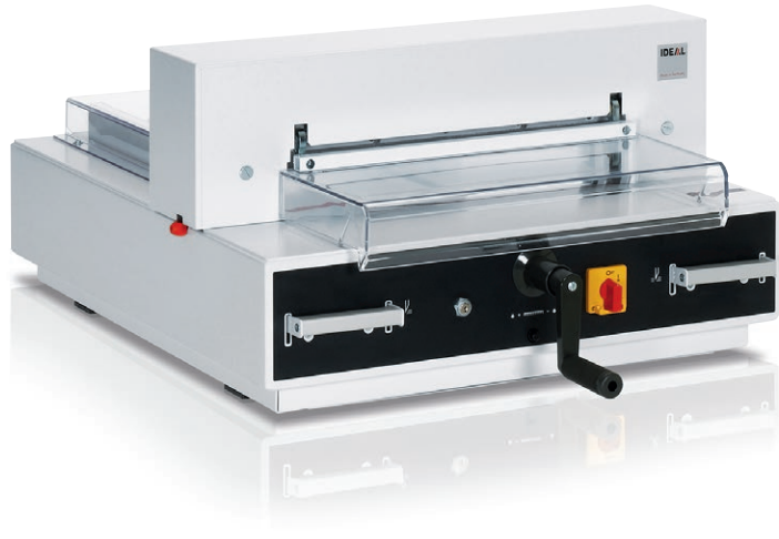
con mueble adicional