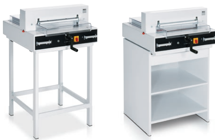
con mesa adicional